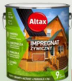
ALTAX IMPREGNAT ZYWCZYNY 9L