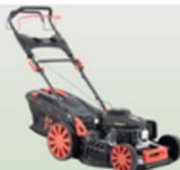
KOSIARKA SPALNIOWA Z NĄPEDEM SHESIN95L-4W1