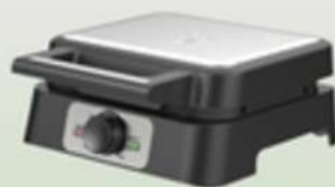
ŁUCZNIK GOFROWNICA WM 015