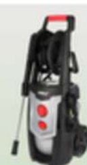
MYJKA CIŚNIENIOWA Z BEZPIEM 400802