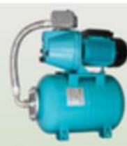
OMNIGENA ZESTAW HYDROFOROWY JET 100A (A) INOX 230V NA ZBIORNIKU 24L Z PRZECIŁĄCZEM