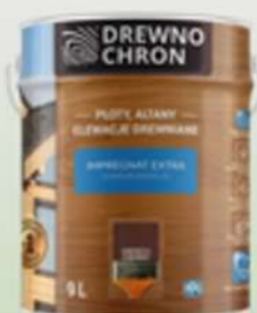
DREWNOCHRON EXTRA ORZECH CIEMNY 9L