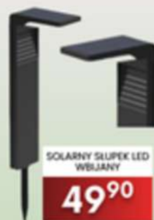
SOLARNY ŚLUPEK LED WBIJANY