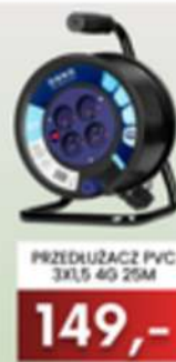
PRZEDŁUŻACZ PVC 3X1,5 40 25M