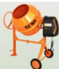
BETONIARKA 3400W 200L SW200