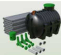
MARSPELAST OCZYSZCZALNA DRENAŻOWA 3000L