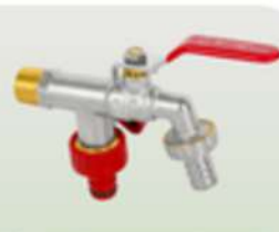
DIAMOND KRAN CZERPALNY Z DŁAWIKIEM PODWOJNY 1/2X3/4X3/4