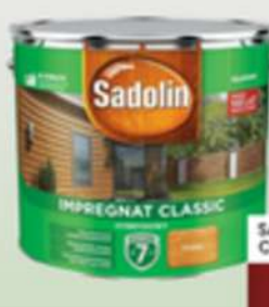
SADOLIN IMPREGNAT CLASSIC PINIOWY 9L