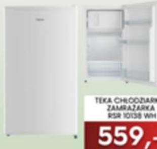
TEKA CHŁODZIARKO- ZAMRAŻARKA RSR 10138 WH