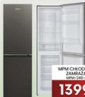
MPM CHŁODZIARKO- ZAMRAŻARKA MPM-248-FF-58

Oferta ważna od 1 do 30 kwietnia lub do wyczerpania zapasów.