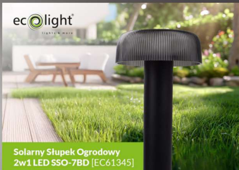
Solarny Słupek Ogrodowy 2w1 LED SSO-7BD [EC61345]