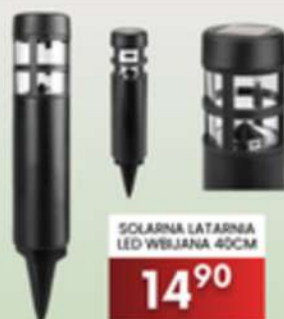
SOLARNA LATARNIA LED WBIJANA 40CM