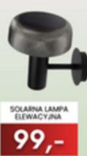
SOLARNA LAMPKA ELEWACYJNA