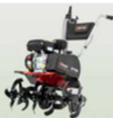
OLEOBRYZARKA SPALNIOWA PRO OP1608 SENK BLS C950