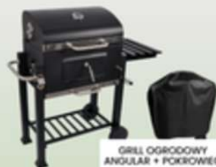
GRILL OGRODOWY ANGIULAR + POKROWIEC