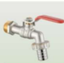
DIAMOND KRAN CZERPALNY 1/2" Z DŁAWIKIEM 3/4"